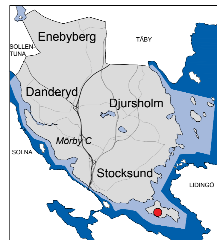
DETALJPLANENS LÄGE I KOMMUNEN